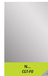
N... CGT-FO --